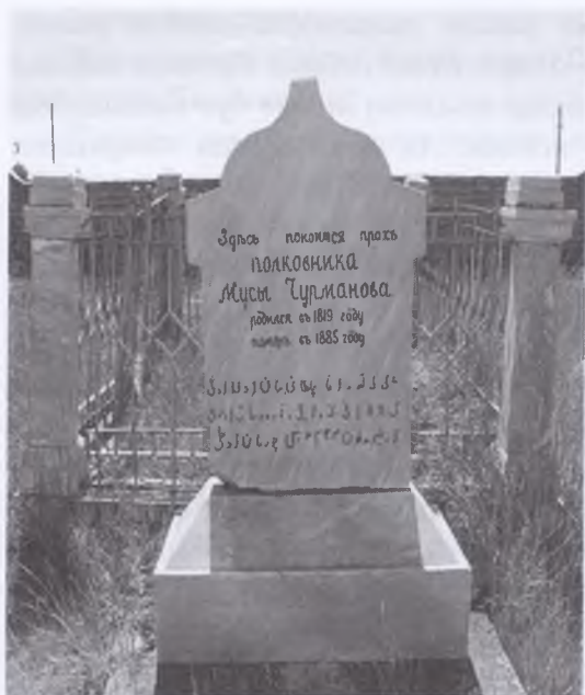
Теңдік ауылындағы әулеттік қорымда жатқан Мұса мырзаның қабірі. Құлпытас сол кезде Петербургтен арнайы жасалып әкелінген